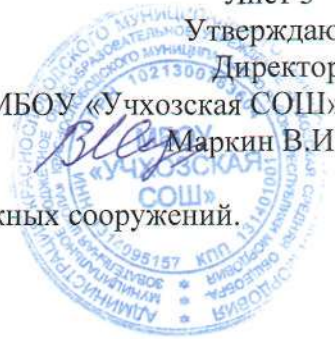
Схема автобусного маршрута № 19 с указанием линейных и дорожных сооружений.